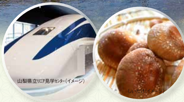
山梨県立リニア見学センター(イメージ)